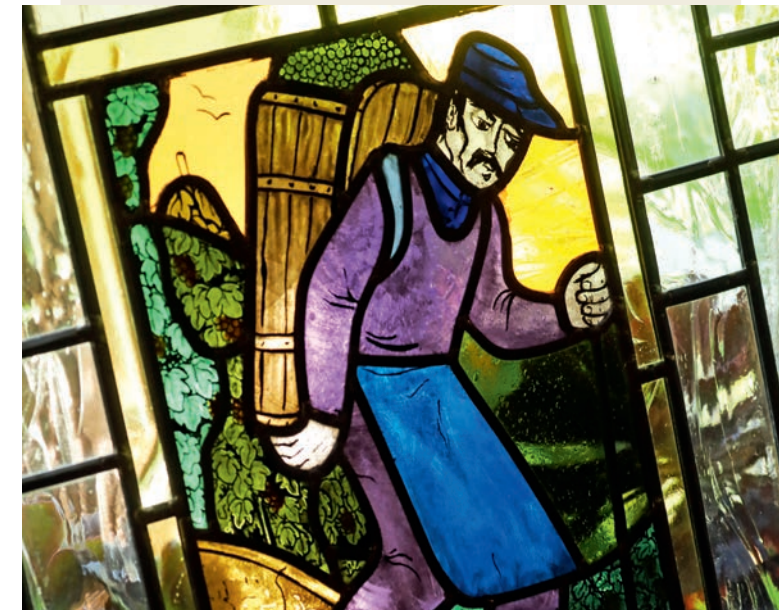
„Ein Winzer im Herbst anno dazumal“: ein Bleiglasfenster welches in unserer Weinstube zu sehen ist.