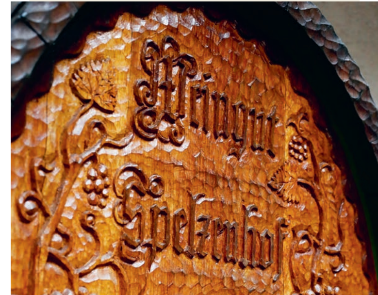
Ein geschnitzter Fassboden ziert seit Mitte der 80er Jahre unseren Spelzenhof