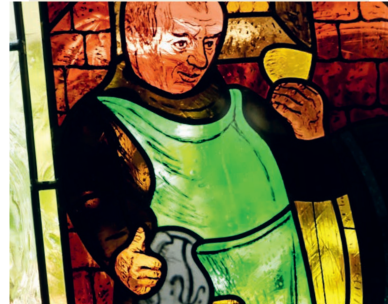
Bleiglasfenster in unserer Weinstube